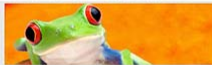
PLoTT Services informatique