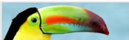
PLoTT Art Imagerie